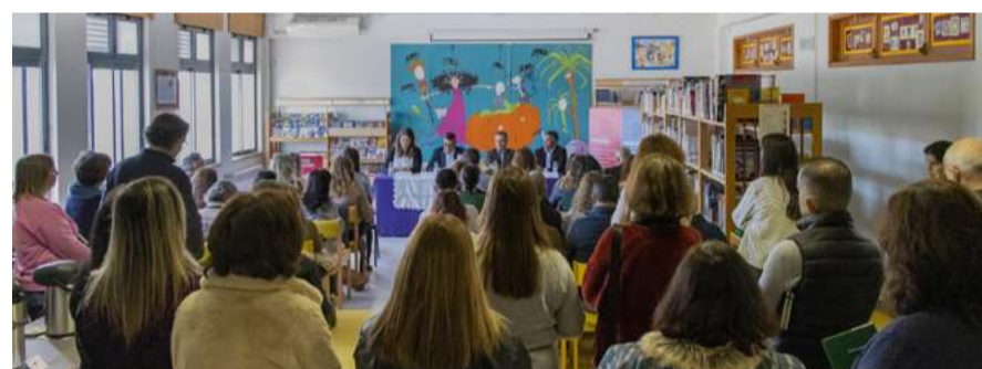
Combate ao insucesso escolar

A sala foi inaugurada a 25 de janeiro de 2024 e, até ao final do ano, recebeu 634 alunos de várias escolas do agrupamento, desde o pré-escolar ao 10.º ano, incluindo ensino especial. Sendo a única Sala STEAM a sul do Tejo, tem despertado o interesse de várias entidades externas, que procuram conhecer esta experiência inovadora e explorar novas formas de ensino mais atrativas e eficazes.