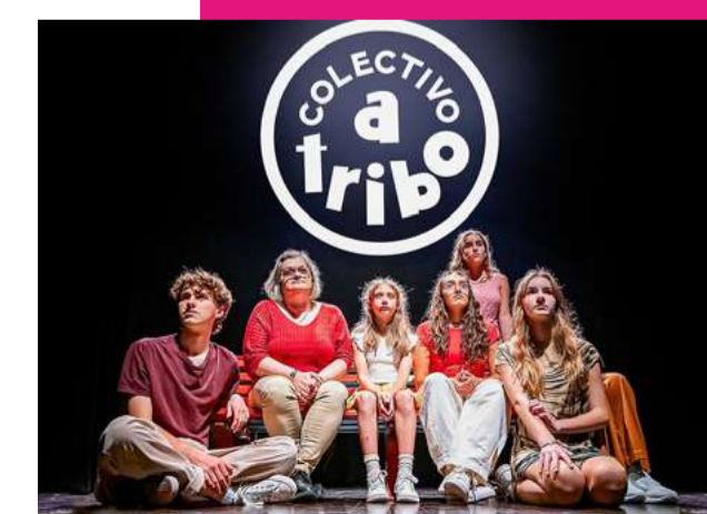
Peça de teatro comunitário

sam fortalecer o seu sentimento de pertença à comunidade. Além disso, promove a inclusão e o trabalho em equipa, permitindo que diferentes pessoas se expressem e se conectem de forma mais integrada.