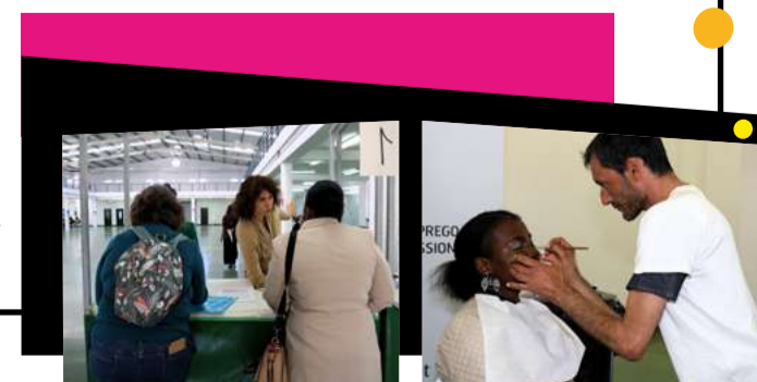
Feira de emprego

A iniciativa permitiu o contacto direto entre recrutadores e candidatos, promovendo a inclusão profissional e dinamizando o mercado de trabalho local. O sucesso do evento demonstra a importância de estratégias que aproximam a população das oportunidades de emprego, contribuindo para um concelho mais dinâmico e economicamente sustentável.