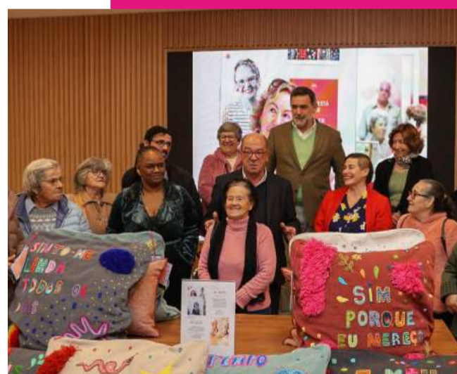
1.ª Exposição de A Avó Veio Trabalhar

Cada “Avó” traz consigo um talento único, e as peças produzidas revelam a habilidade e o carinho dedicados a cada criação. A iniciativa