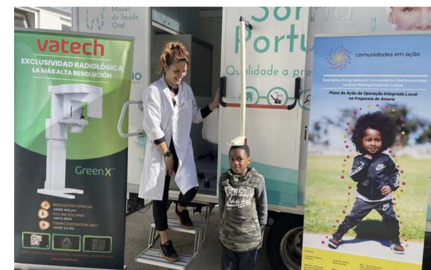
Projeto "Bairro Sem Cárie"