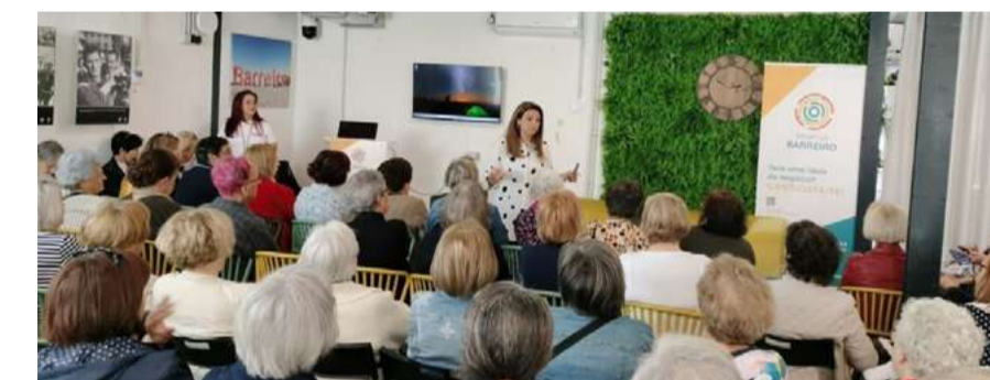
Projeto “Abraça a cidade”

Até ao momento, foram sinalizados 60 casos, com 46 acompanhamentos ativos, abrangendo principalmente pessoas a viver sozinhas. A maioria enfrenta não apenas o isolamento social, mas também dificuldades financeiras e falta de rede de apoio. O acompanhamento é feito através de contactos presenciais, telefónicos e digitais, permitindo uma resposta mais eficaz e próxima. Com esta abordagem, o projeto procura melhorar a qualidade de vida dos participantes, reforçar a inclusão social no concelho e incentivar uma maior participação da comunidade nas dinâmicas locais.