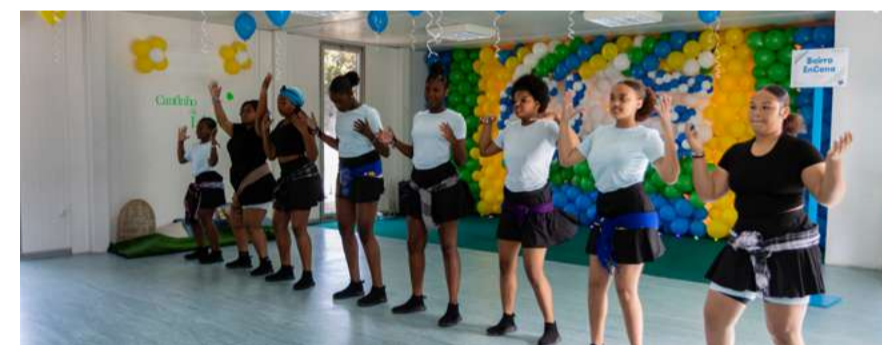
Projeto “Bairro EnCena”

Com 50 jovens dos dois territórios já envolvidos, o “Bairro EnCena” tem alcançado um impacto significativo, chegando também a mais 300 residentes através dos espetáculos já realizados. O projeto aposta ainda na divulgação digital dos conteúdos criados, inspirando outros jovens e ampliando o alcance da iniciativa.