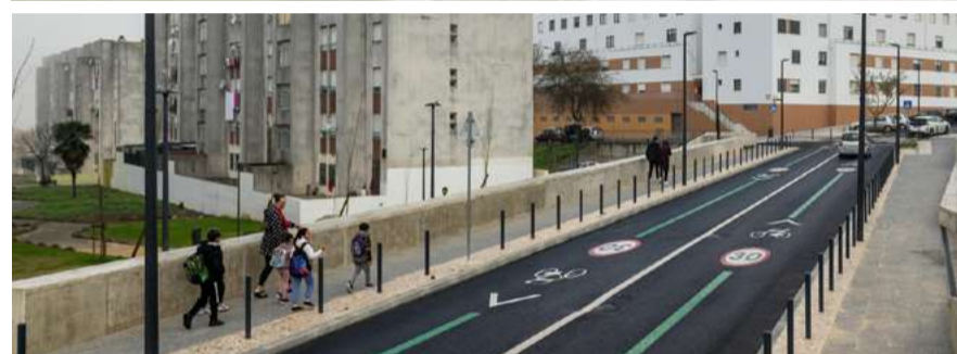
Via Estruturante e de Coesão de Santa Clara

e o desenvolvimento de um ambiente comunitário mais forte e coeso.