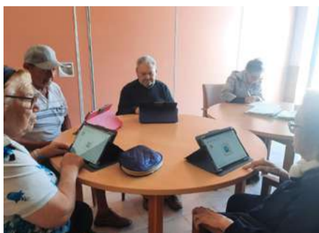
Projeto “Ginásio Cerebral”