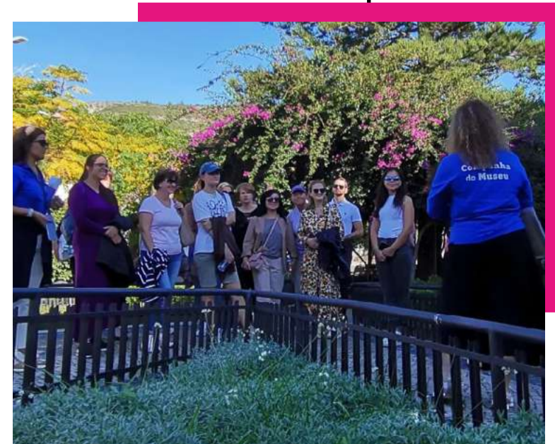
Formandos em visita de património

A aprendizagem decorre no Centro Raio de Luz, em Sampaio, e integra-se num projeto da Câmara Municipal de Sesimbra, financiado pelo Plano Metropolitano de Apoio às Comunidades Desfavorecidas, com apoio do Programa de Recuperação e Resiliência.