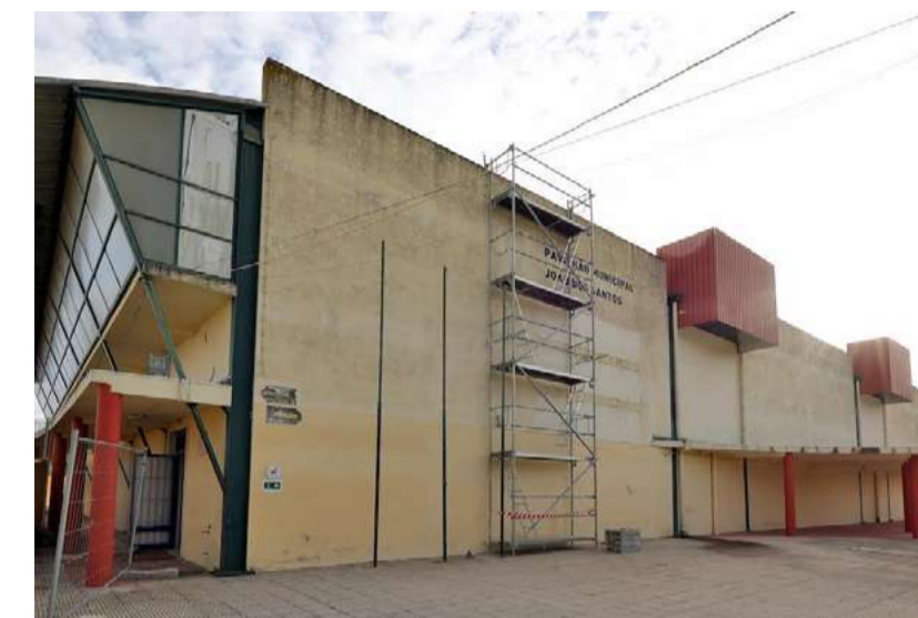
Pavilhão Municipal João dos Santos

Este investimento não só moderniza as infraestruturas, como também reforça o compromisso com a promoção do desporto no território, envolvendo diversas entidades parceiras e incentivando a participação ativa da comunidade. O pavilhão continuará a ser um ponto de encontro para diferentes gerações, promovendo hábitos de vida saudável e fortalecendo laços comunitários. Através da prática desportiva, pretende-se estimular a inclusão social, fomentar valores como o respeito e a cooperação, e contribuir para o desenvolvimento de uma identidade coletiva mais forte.