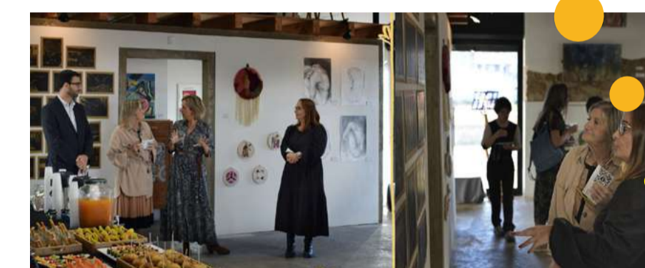
Projeto "Saúde LoucaMente"

O projeto utiliza a arte (pintura, cerâmica e têxtil) como ferramenta para estimular a criatividade e promover o bem-estar mental, oferecendo um espaço de expressão e apoio à saúde mental da comunidade.