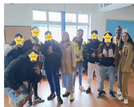
Jovens de etnia cigana

educativos, dança tradicional, jogos desportivos e diálogos pedagógicos, nas OIL (Camarate, Unhos e Apelação, Santa Iria de Azóia, São João da Talha e Bobadela).